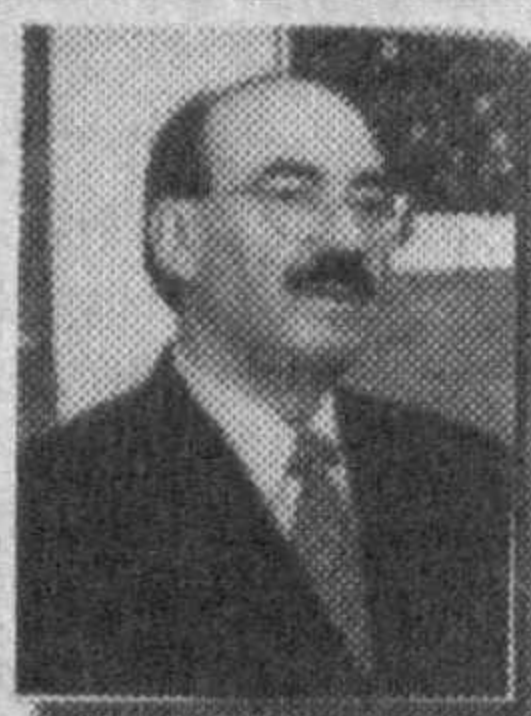
Дмитрий ОСТАПЕНКО , Украина маданият ва санъат ишлари вазири:

— Ўзбекистонда ўтаётган Украина маданияти кунларида республикамизнинг машҳур профессионал бадий гуруҳлари ва халқ ансамбллари, таниқли адабиёт ва санъат намояндalari иштирок этмоқдалар. Улар гўзал Тошкентнинг маданият саройлари ва концерт залларида, Ўзбекистоннинг шаҳар ва қишлоқларида, меҳнатқашлар ҳузурида ўз маҳоратларини намойиш этидилар, томошабинлар билан ижодий учрашувлар ўтказдилар.