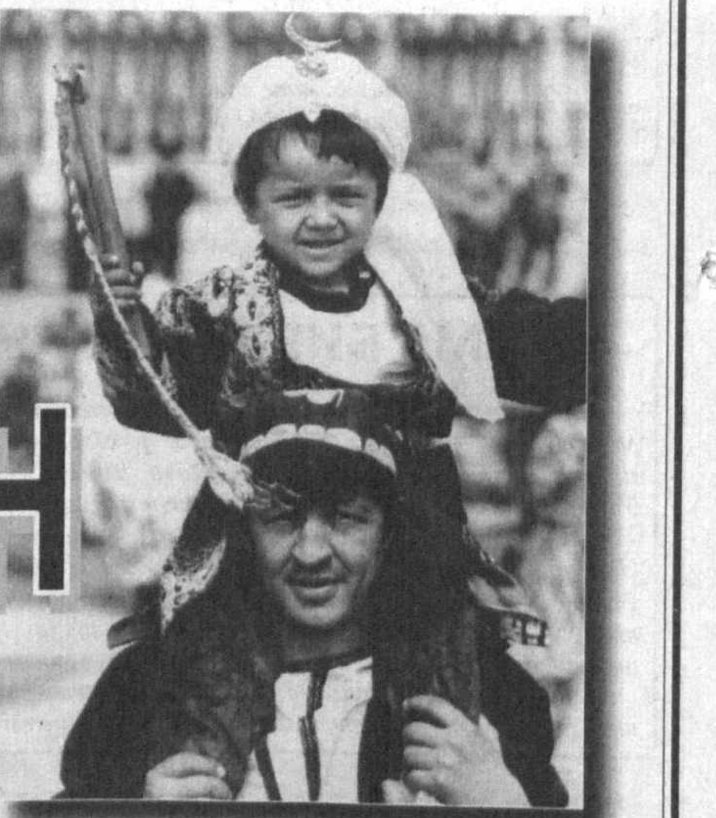
Ҳаммаси бошқача, барибир янгиҷадир.

Чунки одамлар аста-секин ўз овозларининг қадрини англайдилар, ҳокимиятнинг шаклланиши уларга ҳам боғлиқ эканлиги тушуна бошлайдилар, иккинчи ёки учинчи мартадан сиёсий иродаларини бир пой поёфазлга олишмайдилар. Ана шу сезилар-сезилмас жараё: ҳокимият объектнинг — одамларнинг ўзгариши демократик ислохотлар учун ҳаммадан ҳам муҳимдир.