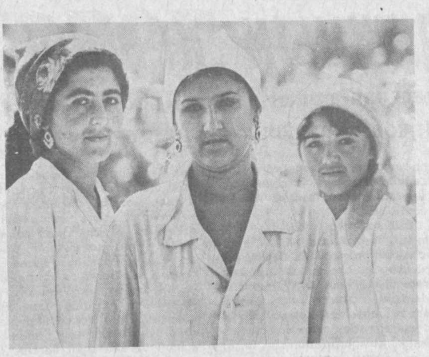
МЫ — ИНТЕРНАЦИОНАЛИСТЫ

НА СНИМКАХ: (слева направо) воспитательница нового детского сада «Бахор» араба