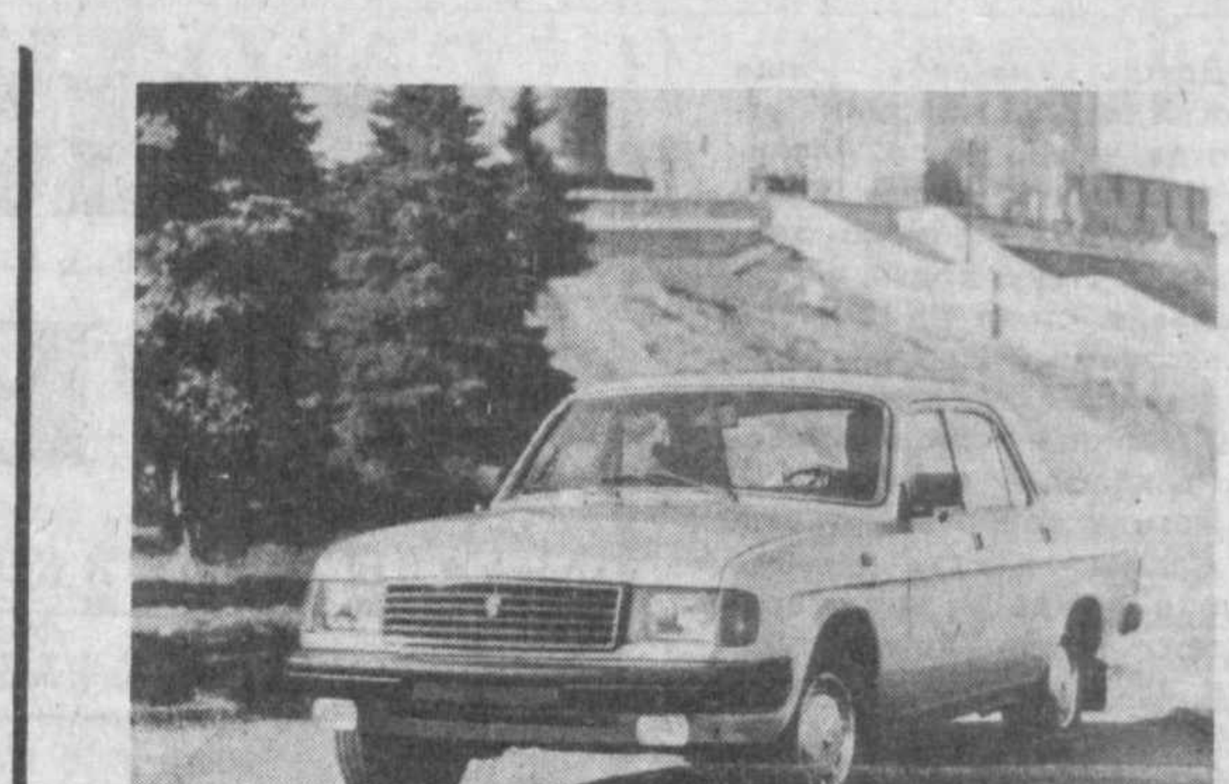
НИЖНИЙ НОВГОРОД. С 1992 года Горьковский автозавод начнет выпуск новой модификации «Волги» — ГАЗ-31029. По сравнению с нынешней серийной «Волгой» у этой модели будут более мощный двигатель, новая коробка передач...