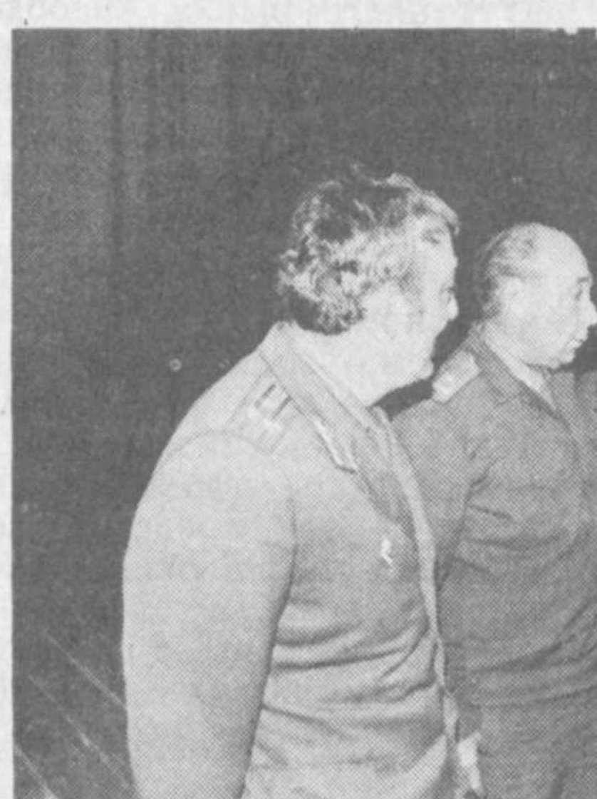
«Ватанпарвар» («Патриот») — так будет называться отныне созданная в Республике Узбекистан новая общественная организация содействия обороне.

Такое решение принято на состоявшемся в Ташкенте внеочередном съезде Республиканского добровольного общества содействия армии, авиации и флоту.