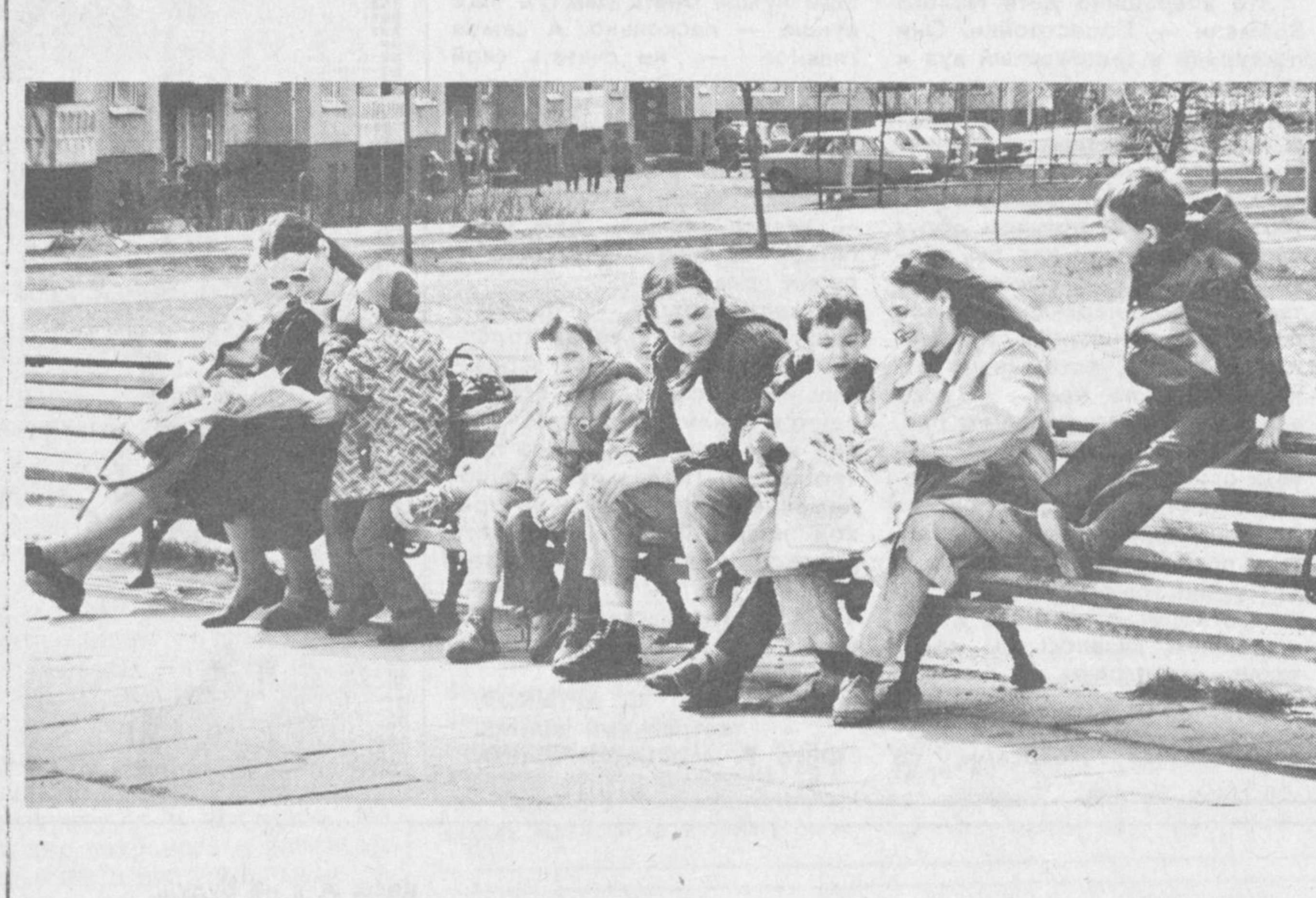
Городские посиделки... Здесь, на скамейках скверов и парков, собираются люди независимо от возраста и интересов.