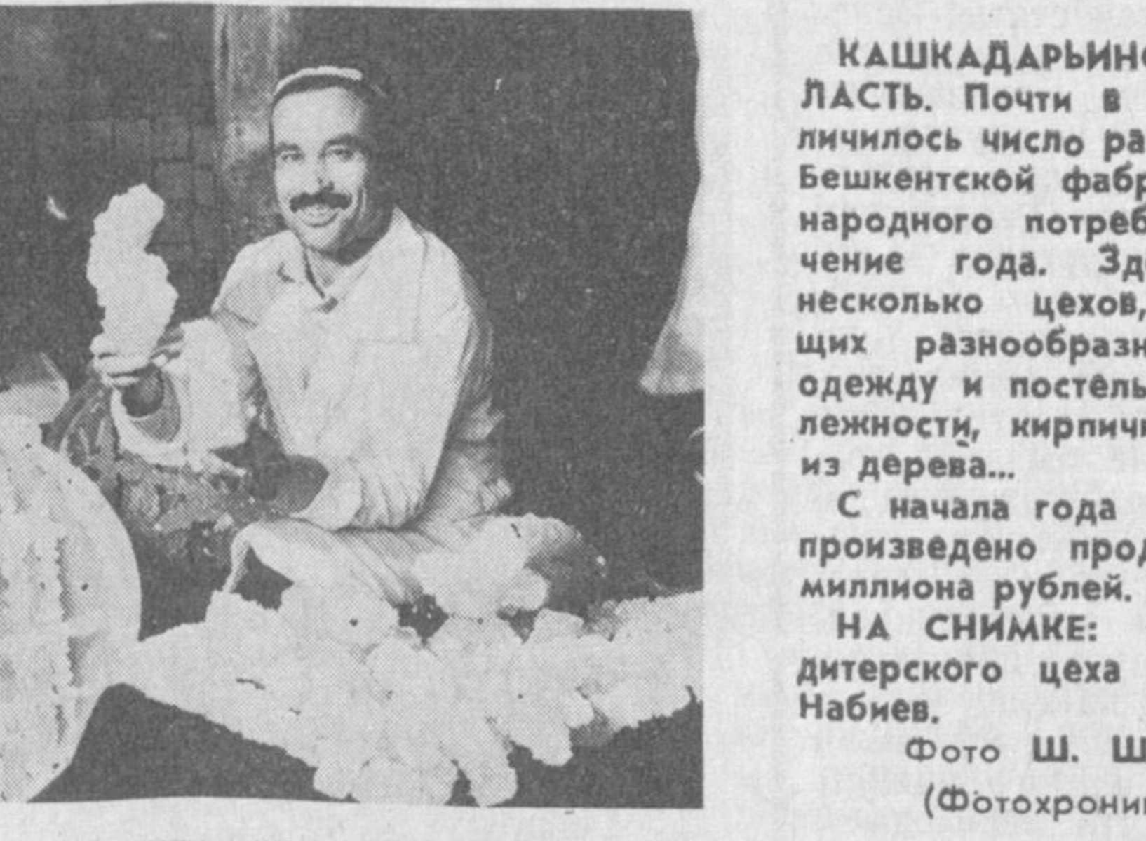
Кашкадарьинская область. Почти в 20 раз увеличилось число работающих на бекинской фабрике товаров народного потребления в течение года. Здесь открыты несколько цехов, выпускающих разнообразную продукцию: одежду и постельные принадлежности, кирпич и изделия из дерева...

УРГЕНЧ «Чуму двадцатого века» — СПИД в Хорезме готовы при первом же его появлении встретить во всеоружии. В областном центре действует центр по профилактике и борьбе со СПИДом, который занимается исследованием крови на наличие антител к ВИЧ. Этим же заняты еще четыре диагностические лаборатории — в Гургане, Кوشкыльге, Хазараспе и Багате. Готовятся к открытию еще три. При всех лабораториях действует кабинеты анонимного обследования.