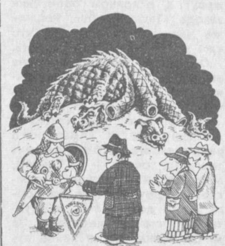
Рис. Ю. ШАКИРОВА.

22 декабря в 13.30 по первой программе Центрального телевидения будет демонстрироваться художественный фильм «До свидания, мальчики», снятый на «Мосфильме» режиссером М. Калликом. Имя его давно известно любителям кинематографа, и сериал, который предлагает нам, смотрится с несомненным вниманием. Вот уже много лет он заставляет соперничать главных его героев. Действительно, есть ли что трагичнее, чем война? Связанные с ней крушения судеб, совсем юных, чьи мечты и прекрасным порывам не суждено никогда сбываться.