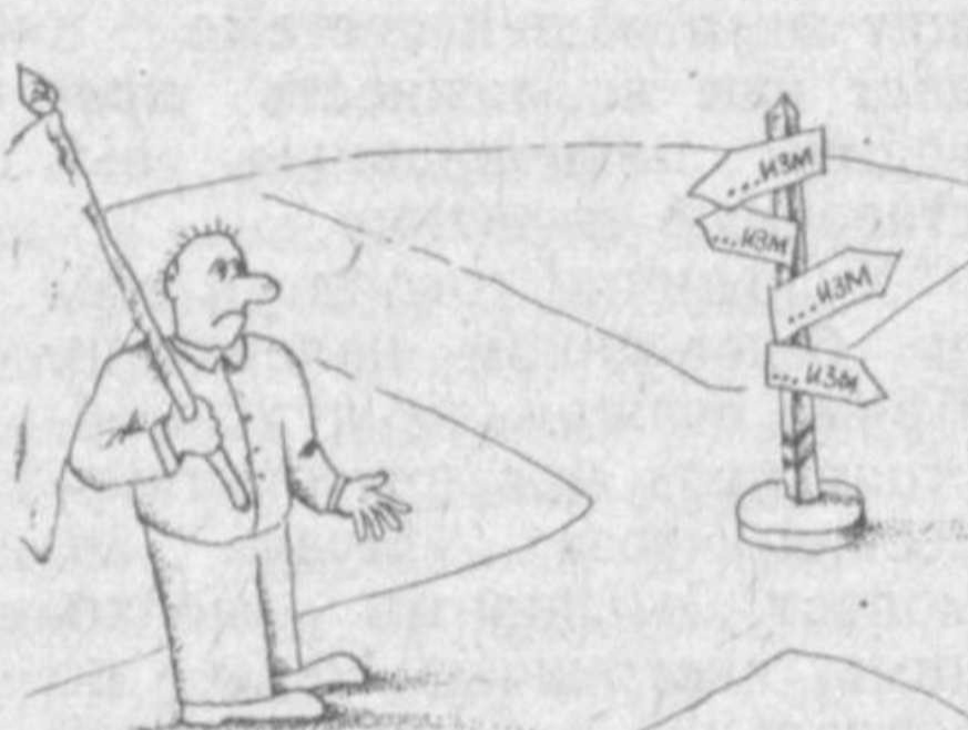
Рис. М. ЖИЯНОВА.