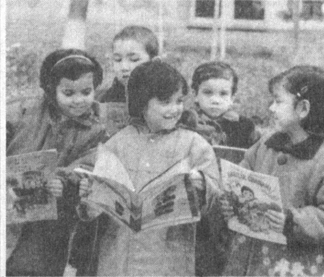
Фахр эт, унутма боболарингни, Сен Темур авлоди, Навоий насли. Соғлом фарзандларга насиб этгайди, Шу азиз юртининг гуллаган фасли.