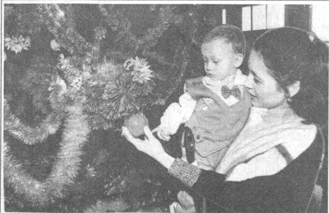
2000 йил мамлакатимизга қутлуғ Йўли Рамазон арафасида таширф бўюрди. Соғлом авлод йили деб эълон қилинган Янги йил хонадонингизга қут-барака келтирсин.