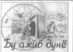
Бу ажиб дунё