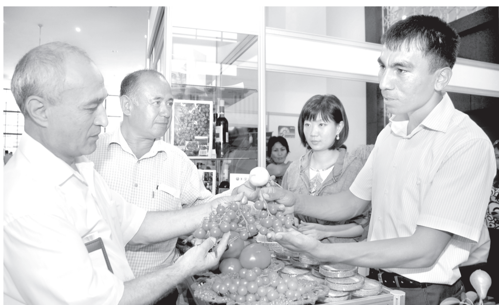
(Давоми. Бошланғич 1-бетда).

Натижада ўтган йили боғимизда етиштирил-