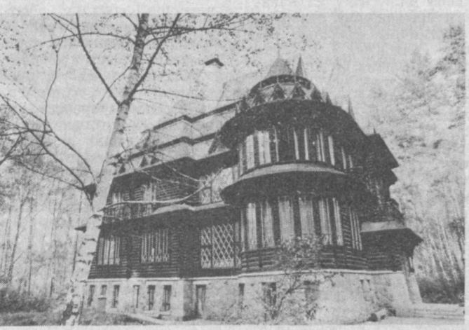
УКРАИНА. Залесское государственное лесно-охотничье хозяйство издавна было известно как фешенебельная база отдыха

дыха для высокопоставленных лиц нашей страны и зарубежных гостей. На содержание этого комплекса, включающего в себя 15 тысяч гектаров угодий и 300 гектаров водоемов, требуется более миллиона рублей в год. До недавнего времени хозяйство было плано-убыточным. Сейчас, в условиях вхождения в рынок, приходится думать, как покрыть расходы на содержание, чтобы сохранить этот заповедный уголок природы, и даже получить прибыль. Один из путей решения проблемы — организация охоты для зарубежных любителей за валюту, что практикуется во многих странах мира. Тем более что плотность заселения некоторыми видами животных значительно превышает нормы для их эффективного размножения и откорма. Например, оленей здесь насчитывается свыше тысячи трехсот при оптимальном количестве — восьмьсот голов. По мнению руководителей хозяйства, охота за валюту не только позволит встать им на ноги, но и закупить импортное оборудование для переработки дичи, выделки шкур животных, производства товаров для населения. Вместе с представителями французской фирмы по производству кормов для животных и организации охотничьего туризма «Витнес» на одну из охот отправился «фоторужьем» и корреспондент. НА СНИМКЕ: бывшая дача Н. С. Хрущева на территории Залесского государственного лесно-охотничьего хозяйства.