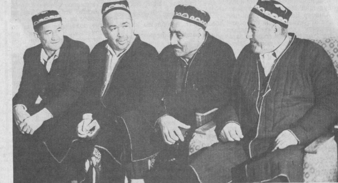
Т. ШАЯКУБОВ, председатель Госкомитета Республики Узбекистан по геологии и минеральным ресурсам.