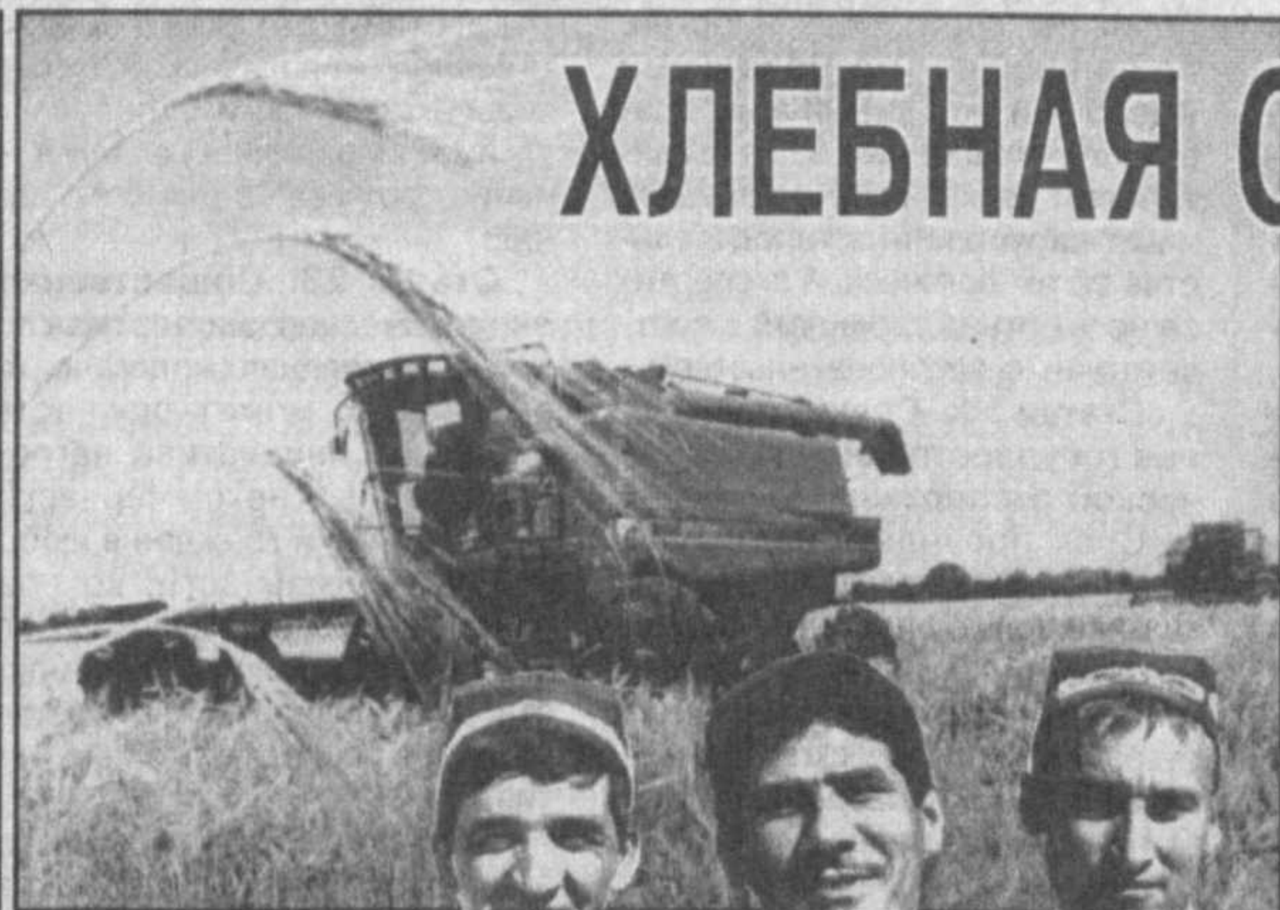
С раннего утра хлебные поля оглашаются рокотом работающих комбайнов. Нынче здесь хлебами засеяли 896 гектаров, урожай озерел на всей площади. С каждого гектара планируют получить по 51 центнеру пшеницы.

В нынешнем году в Хорезмском оазисе урожай колосовых созрел раньше обычного. По проселочным дорогам уже поплыли караваны с отборным зерном. В числе первых приступили к уборке колосовых зерноводы Хивинского района.