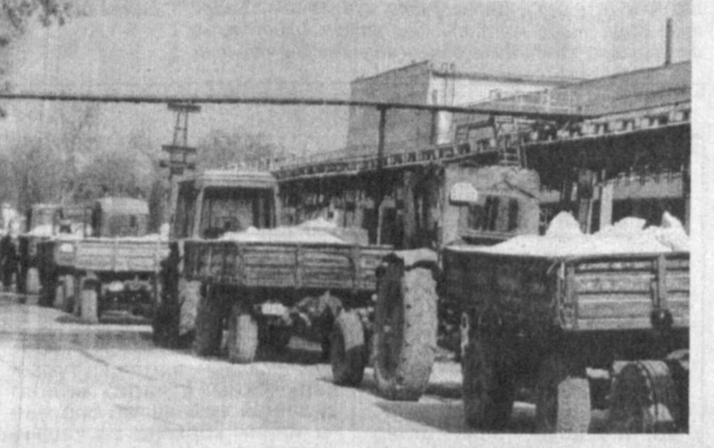
БУЛАРГА ХАВАСИ КЕЛАДИ

Қўқондаги «Суперфасфт» акциядорлик жамиятида қишлоқ хўжалиги учун зарур бўлган турли минерал ўғитлар ишлаб чиқарилади.