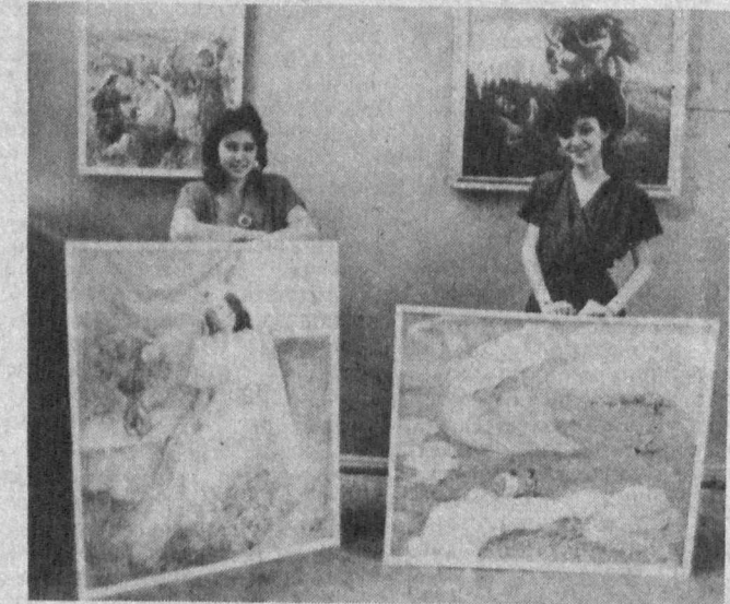
Состоялся очередной выпуск Республиканской средней специальной школы-интерната искусств...