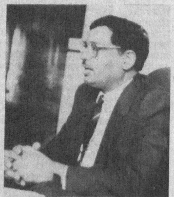
Посол Исламской Республики Пакистан в Узбекистане Шафкат Али Шайхом.

— Уважаемый господин посол, думается, нет необходимости рассказывать, что корень дружественных связей между нашими народами уходит в далекую историю. Оба наши государства пережили и период враждебности. Скажите, какое значение Вы придаете установлению дипломатических отношений между нашими государствами?