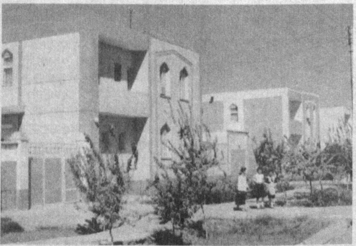
бўлгани йўқ. Ўзининг укувлилиги, ҳаракатчанлиги, изланувчанлиги сабаб, нафақат нефтчилар шаҳарчасида, балки Қоровулборзор туманида ҳам обрў-этибор тоғди.

Гулчехраҳон бу соҳада иш бошлаганига унча кўп