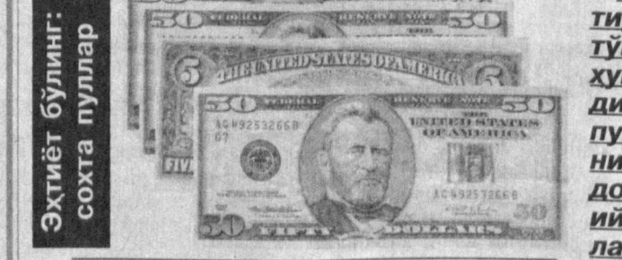
Эҳтиёт бўлинг: сохта пуллар

Ҳар бир алоқа бўлимида «Ахборотнома»га обуна бўлиш шартлари ҳақида янада муфассалроқ маълумотлар олиш ва обунани бетахт расмийлаштириш мумкин.