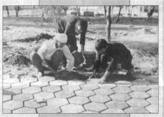
СУРАТЛАРДА: 1. Риштондаги «Соҳибни Ҳидоя» макбара зиёратгоҳида ишлаётган 78-қурилиш ташкилоти бошлиғи С. Қодиров, иш юритувчи И. Мирзаев, қурувчи И. Салоҳиддинов, бригада бошлиғи Т. Аҳмедов галдаги режани белгилашяпти; 2,3,4-аллома номи билан аталувчи истироҳат боғи қурилишидан лавҳалар ақо эттирилган.