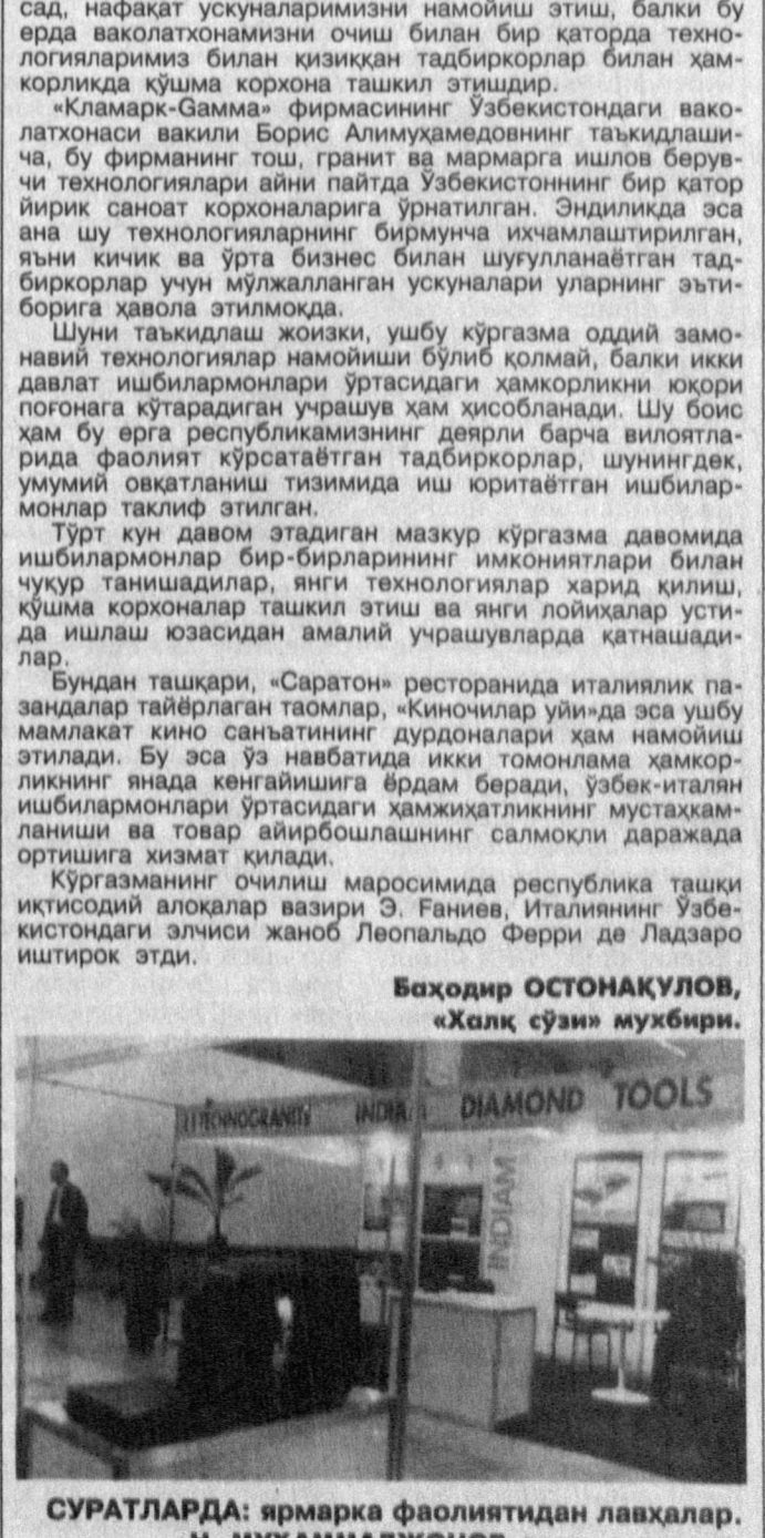
СУРАТЛАРДА: ярмарка фаолиятдан лавҳалар.

Баҳодир ОСТАНАКУЛОВ, «Халқ сўзи» мухбири.