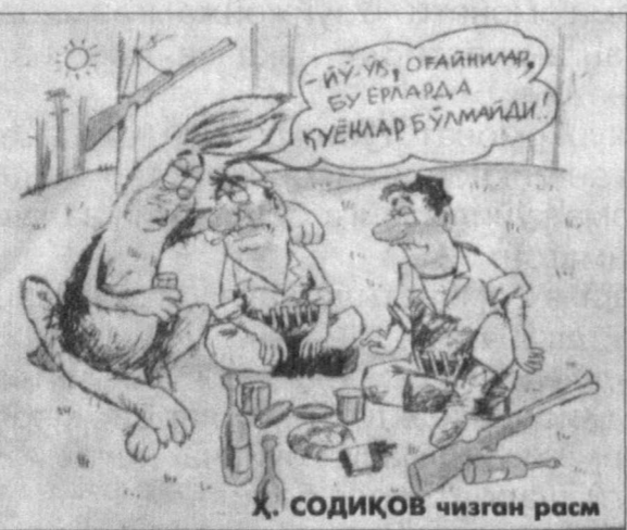
Х. СОДИҚОВ чизган расм

Қисса яқин ўтмишдан олиб ёзилган. Бинобарин, ёзувчининг кўп вақти архивларда ўтган. Тарихий манбаларни топиш осон бўлмаган, албатта. Шунда ўйлаб қоламан. У бунча кучини, гайратини қайнаб олаётми? Назаримда, унга куч ато этган нарсаси — бу Мустақиллик. Тарихий ҳақиқатни бадиий тарзда ёш авлод онгига сингдириш, шу тарихи Мустақиллик манфаватларига хизмат қилишдан ортиқ саодат йўқ унга. Шунинг учун ҳам элимизда эъзоз топмоқда. Қашқадарёлик ижодкорлар уни иродаси темирдан, дейишди. Бу гапда жон бор. Зеро, шундай одамлар эл қорига ярайди.