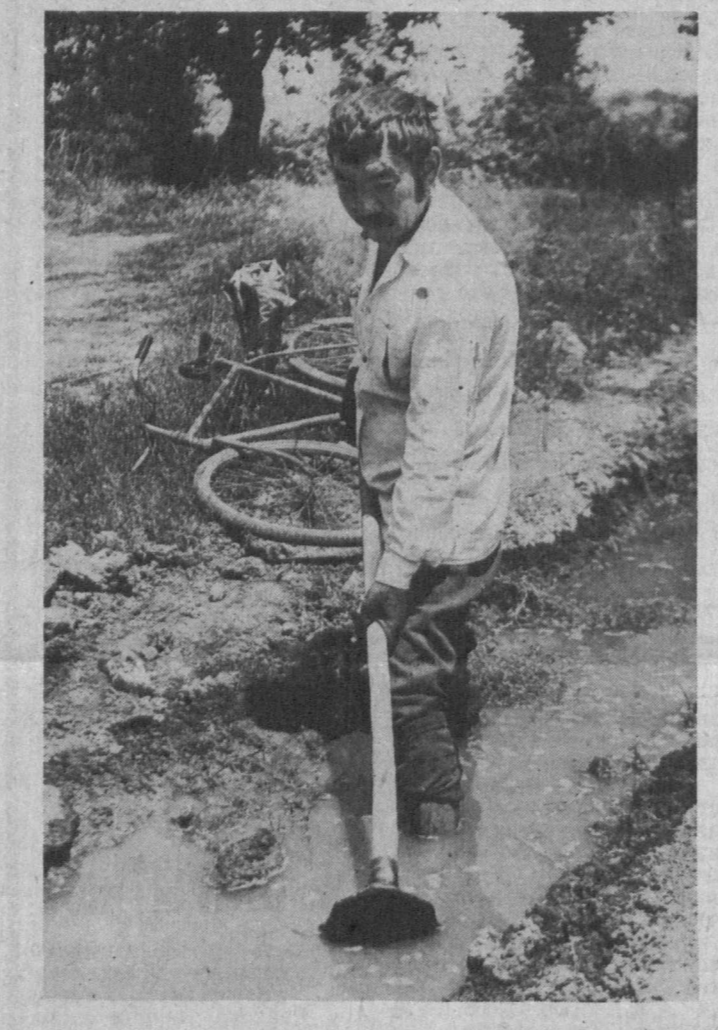
НА СОБСТВЕННОМ ОПЫТЕ

Или еще одна проблема — трудоустройство. Правление хозяйства старается, чтобы среди жителей наших кишлаков не было безработных. Создана специальная комиссия определяет таких людей, предлагает им ту или иную работу. Рабочих мест у нас немало: создали 15 малых предприятий — рабхозмастерскую, цех по изготовлению окон и дверей, автомастерскую, цех по производству мебели. По итогам прошлого года колхоз получил свыше 2 миллионов рублей чистой прибыли. Распоряжается ею кишлаки сами: перестраивают кишлаки, возводят сауну на животноводческой ферме, новую врачебную амбулаторию. Полным ходом идет газификация кишлаков, строят новую баню, ремон-