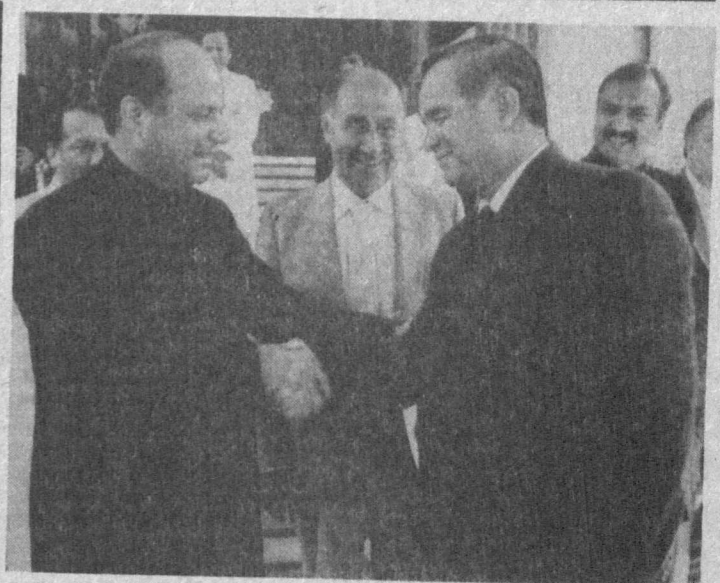
Узбекистан — Пакистан:

О задачах аппарата хокима можно говорить много. Это и социальная защита населения, и обеспечение товаров и продуктами первой необходимости, трудоустройство, и создание благоприятных условий для развития предпринимательства.