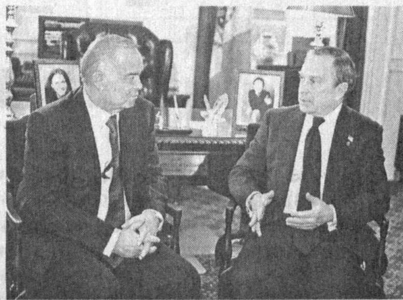
Во время встречи в Нью-Йорке.