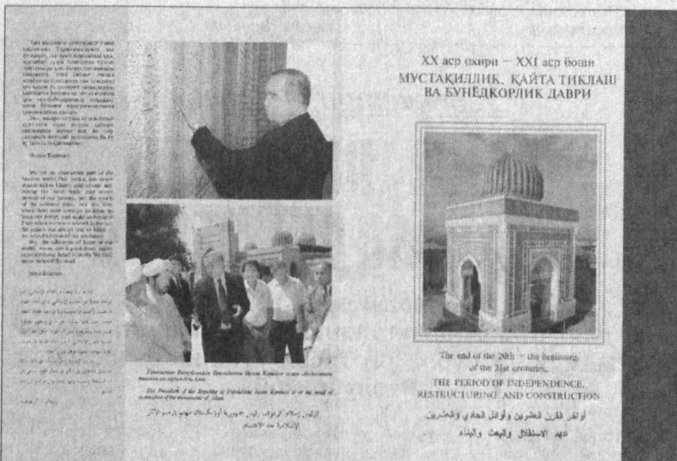
XX аср охири — XXI аср боши МУСТАКИЛЛИК, ҚАЙТА ТИҚЛАШ ВА БУЎИДҚОРИК ДАВРИ