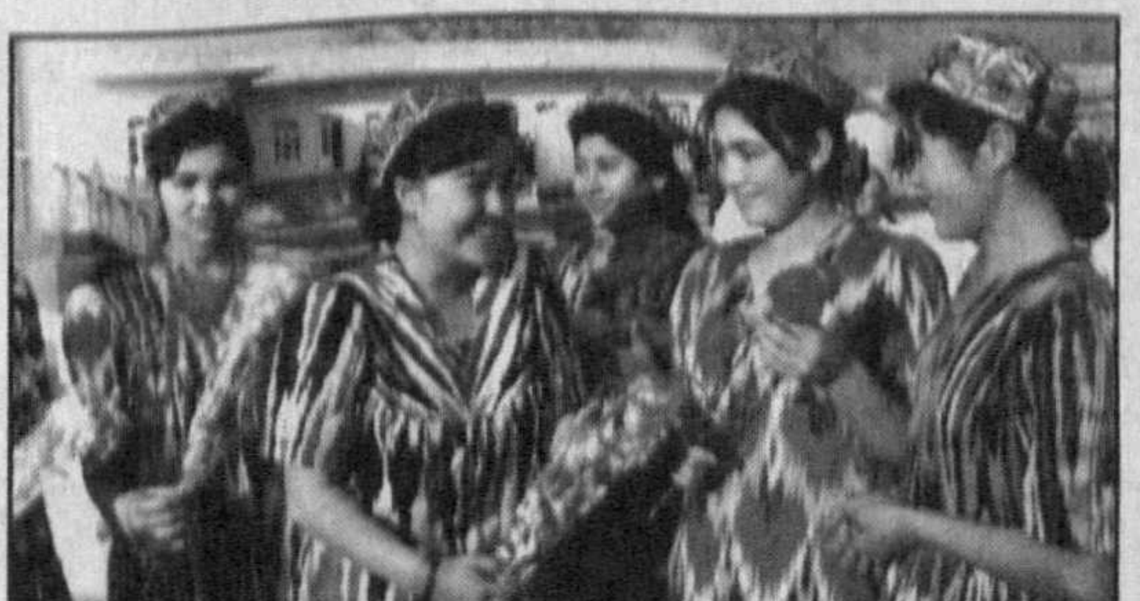
НА СНИМКАХ: центральная площадь Папа; так здесь проходят спортивные праздники; молодость Папа.

МЕЖДУНАРОДНЫЙ ЭМИССИОННЫЙ СИНДИКАТ 8 мая 2002 года проводит ПРЕЗЕНТАЦИЮ ВЫПУСКА И РАЗМЕЩЕНИЯ КОРПОРАТИВНЫХ ОБЛИГАЦИЙ СП "N.Com", ДП "NCI Projects" и фирмы "Асклепий".