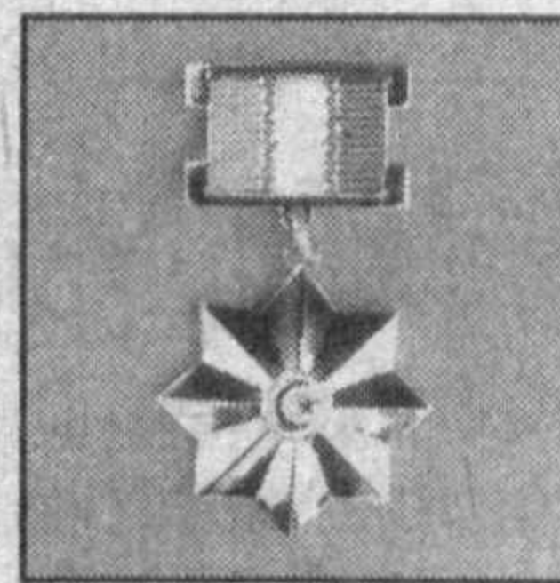
деятельности людей. Скажем, лиц, показавших достойную

Если мы обратимся к истории национальной государственности в древности, к примеру, во времена правления сахибкрана Амира Темура, звания и награды являлись своеобразным критерием поощрения лучших представителей народа, оценки честного труда и созидательной