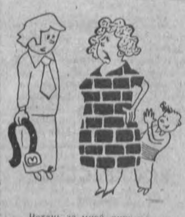
Встань за мной, шучек, и ничего не бойся.

В нем, в частности, предусмотрено более широкое использование ведомственных стадионов и спортивных залов для занятий физкультурой населения.