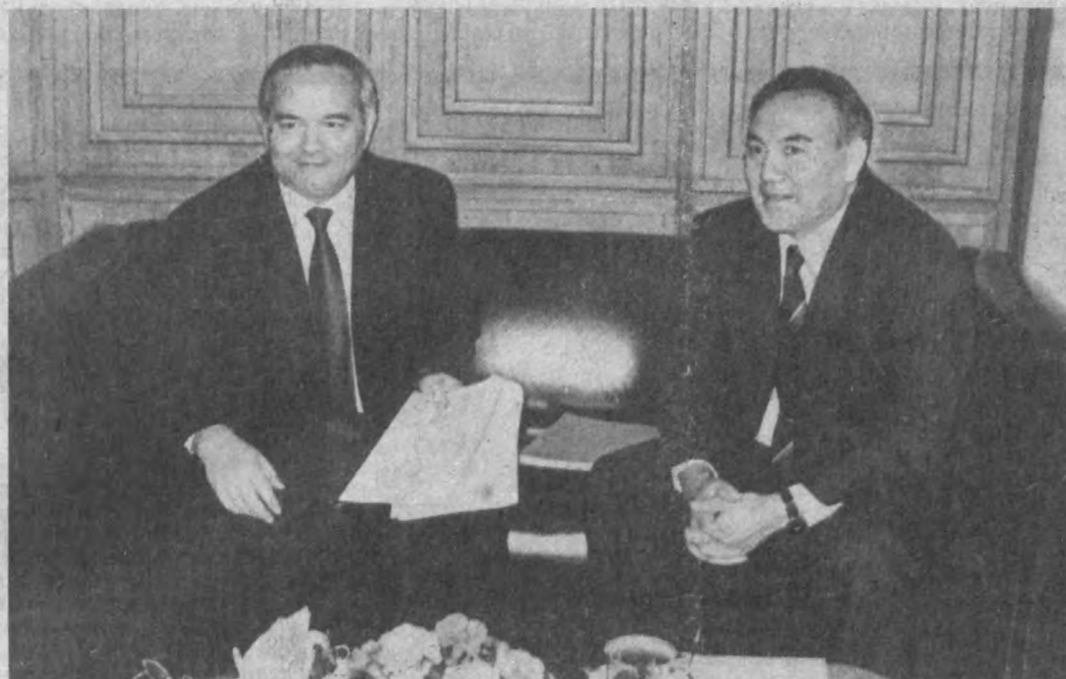
Президент Узбекистана Ислам Каримов и Президент Казахстана Нурсултан Назарбаев на встрече в Алматы.

В обеспечении стабильности в Центральной Азии, расширении взаимных связей большая роль принадлежит двусторонним отношениям между двумя братскими странами — Узбекистаном и Казахстаном. И не случайно, что только в прошлом году руководители двух наших государств встретились несколько раз в Ташкенте, Алматы, Кочетаве, Кызыл-Орде, Чимкенте. Ибо ситуация в Центральной Азии и материке во многом зависит от политики, проводимой этими двумя круп-