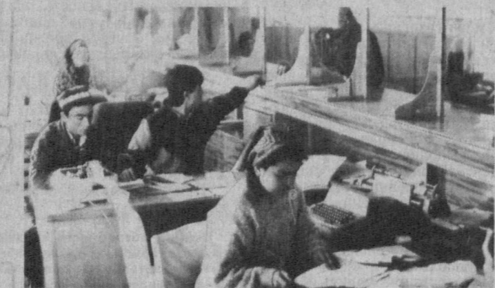
Недавно в Касансайском районном отделении Государственного банка был открыт обменный пункт, который сможет обслуживать и соседний Олабукинский район. Это удобно поправилось обоим сторонам. Теперь банк сможет временно проводить денежные операции между городом и различными учреждениями района.

отношениях не может сложиться без выполнения двух основных условий: повышения культуры обслуживания покупателя и наличия товаров на прилавках.