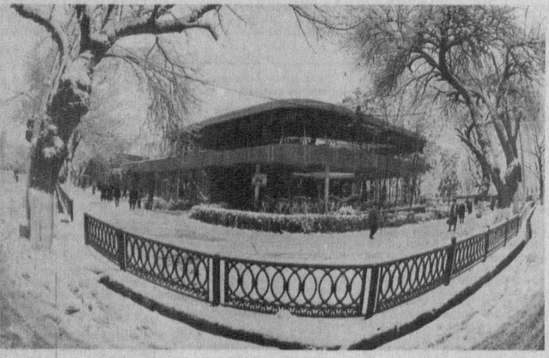
Последние капризы зимы.