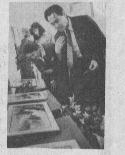
НА СНИМКАХ: у стенда с произведениями искусства мастеров живописи КНДР.

Дочернее предприятие «АРМАЗ-ДЖАХОН» извещает о том, что оно 9 февраля 1994 года зарегистрировано Министерством финансов Республики Узбекистан и внесено в Регистр филиалов совместных предприятий, расположенных на территории Республики Узбекистан, с участием узбекских и иностранных юридических лиц и граждан. Совместное предприятие расположено по адресу: Республика Узбекистан, г. Ташкент, Ц-1, ул. 1 Мая, 33-а.