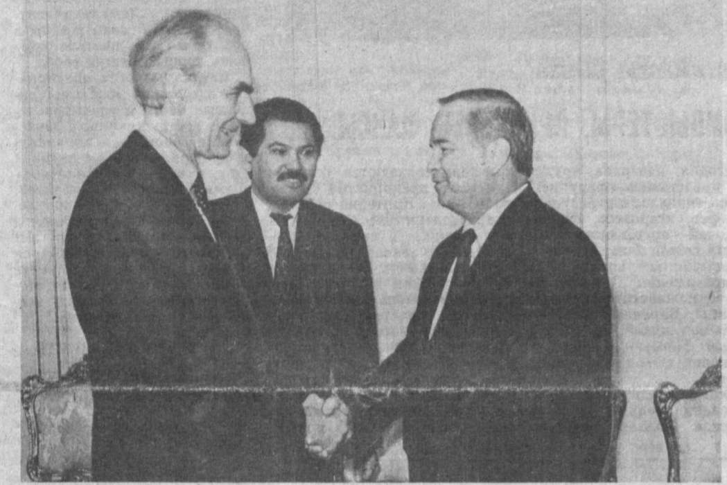
НА СНИМКЕ: во время встречи у Президента.

Члены делегации Совещания по безопасности и сотрудничеству в Европе в тот же день побывали в Верховном Совете Узбекистана, в Министерстве иностранных дел республики и в Ташкентском университете мировой экономики и дипломатии.