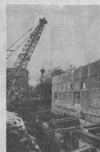
территория, появляются новые автомагистрали.

Но главная забота строителей и хокимията — возведение жилья. Казалось бы, совсем недавно в благоустроенные квартиры вселили 3800 семей, ютившихся в ветхих домишках в поселках Башлык, Ивановских ткачей, Буржарском, на Парфюмерной. А сегодня на их месте возросли новые микрорайоны с высокими домами и объектами социальности — Кушбег и Башлык. Помимо развитой инфраструктуры, здесь благоустроена прилегающая