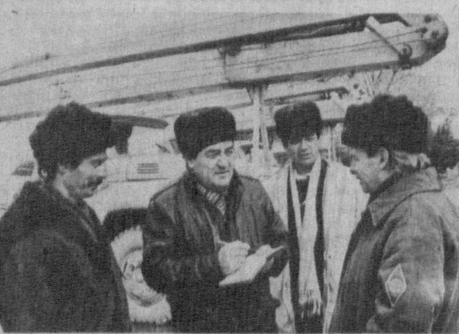
В Карши приватизировано городское управление производственного объединения «Узстроймеханизация». Разнообразная техника, а ее здесь насчитывается более ста единиц, работает на строительных объектах области. Приватизация, по мнению работников управления, главный фактор повышения производительности труда и качества работы.