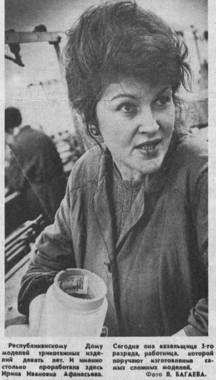
Сегодня она авлазница 5-го разряда работница, которой поручают изготовление самых сложных моделей.