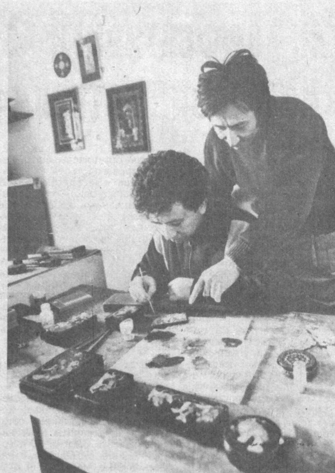
«УСТО» — ЗНАЧИТ «МАСТЕР»

Ташкент. Далеко за пределами Узбекистана пользуются славой изделия мастеров художественно-производственного объединения «Усто».