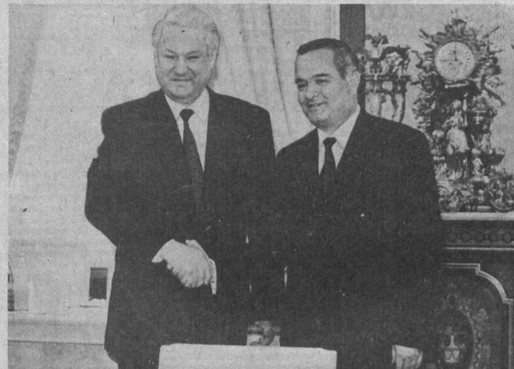
НА СНИМКАХ: Президент Республики Узбекистан Ислам Каримов и Президент Российской Федерации Борис Ельцин;