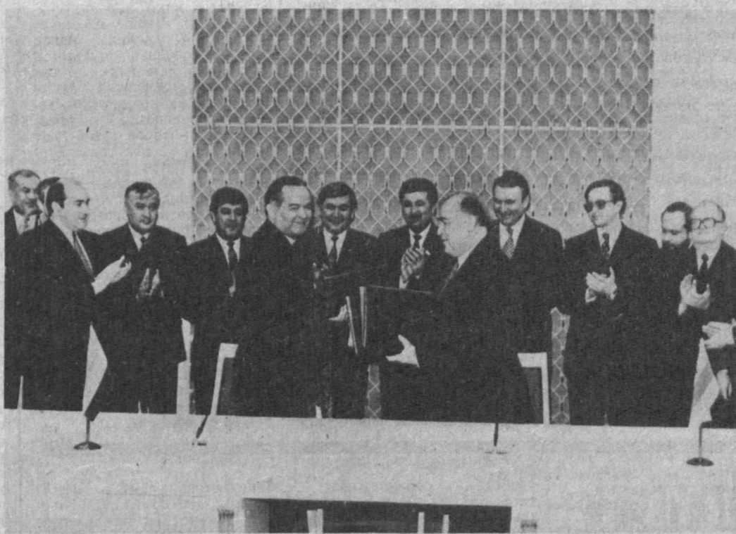
во время подписания документов Президентом Республики Узбекистан Исламом Каримовым и премьер-министром России Виктором Черномырдиным.

Как сообщалось, 2—3 марта государственная делегация Республики Узбекистан, возглавляемая Президентом Исламом Каримовым, находилась с официальным визитом в Москве. Стало привычным, что руководители стран Содружества — частые гости этого города. Как бы то ни было, Москва — столица бывшего Союза! Не секрет, что большинство республик, входящих в этот Союз, и поныне связаны тысячами нитей. Во многих совещаниях и встречах, которые проводились здесь, принимал участие и руководитель нашего государства. Однако этот очередной приезд заслужил особое внимание потому, что Президент независимого Узбекистана первым из руководителей государств Содружества прибыл в Россию с официальным государственным визитом. Аэропорт Внуково, где были вывешены государственные флаги Узбекистана и России, почетный караул, выстроившийся для церемонии встречи, исполнение гимнов двух государств, весь официальный ритуал встречи Президентом России высокогостя — Ислама Каримова в знаменитом Георгиевском зале Большого Кремлевского Дворца — все это свидетельствовало о самом высоком ранге этого визита. Переговоры начались с беседы двух президентов в неформальной обстановке. Они обменялись мнениями о состоянии политических и экономических