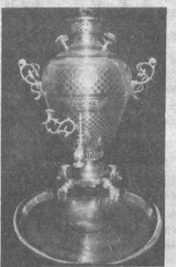
Исторический предмет из собрания Музея истории Узбекистана.

Все, что в свое время для этих людей было объединены предметами утвари, в на-