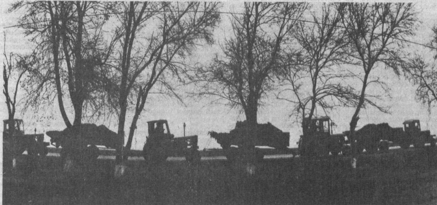
В республике начались весенне-полевые работы.