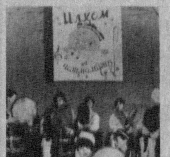
НА СНИМКАХ: сводный ансамбль доисториков из школ №№ 118, 26, 73.

Бесспорность этой истины подтверждают моменты очередного весеннего смотр-конкурса «Ихлом чашмалари» («Родина вдохновения»). Уже не первый год он проводится в школах Янказарайского района г. Ташкента.