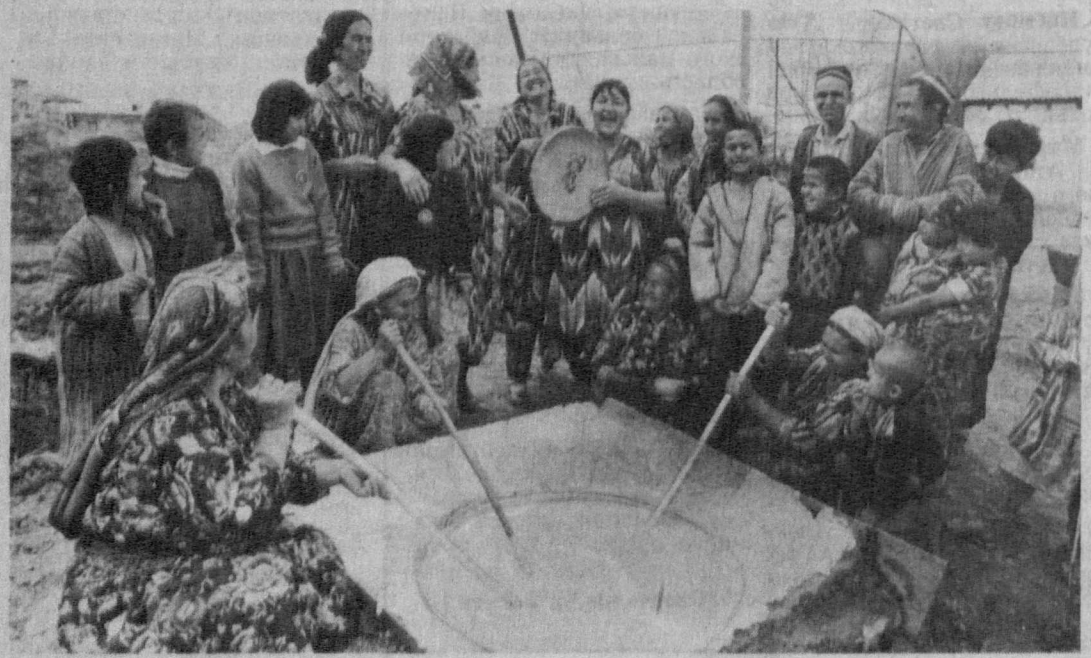
Науруз — праздник весны, мира, он приходит в каждый дом. Приходит вместе с сумалаком, угощением, приготовит которое — большое мастерство. Варят его всю ночь, и сопровождается все это рассказами, песнями, танцами, шутками. Эти снимки сделаны в колхозе имени Навои Боймуратова Джиркурганского района Сурхандарьинской области. И раз варят сумалак, значит, в доме спокойно и мирно...

А. ХАТАМОВ, соб. корр. «Народного слова».