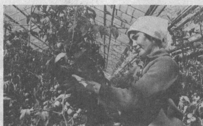
САМАРКАНДСКАЯ ОБЛАСТЬ. Колхоз имени Ф. Косымова — хозяйство многоотраслевое. Стабильно трудятся сельчане, на всех участках видна рука рачительного, умелого хозяина.