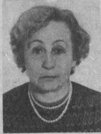
Галина Анатольевна Пугаченкова