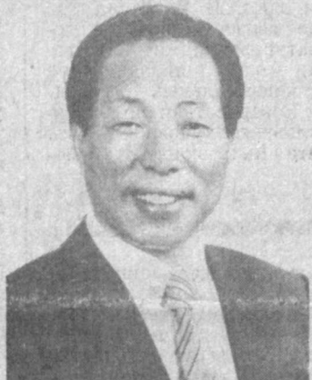
Се Ген И, посол Республики Корея в Узбекистане.

Родился 2 декабря 1940 г. В феврале 1988 года закончил отделение философии Сеулского национального университета. 1965 г. — поступил на работу в Министерство иностранных дел. 1969 г. — 3-й секретарь посольства Республики Корея в Тайбэе. 1976 г. — 1-й секретарь посольства Республики Корея в Кувейте. 1980 г. — начальник консульского отдела бюро консульских и международных и дипломатических представителей МИД.