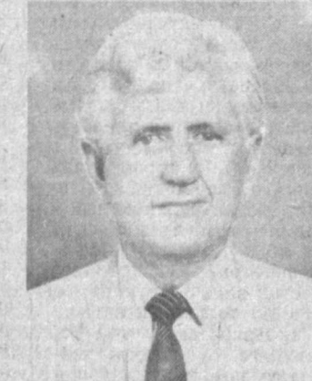
Корнелиус Франсуа Якобс, посол Южной Африканской Республики в Узбекистане.

Г-н К. Ф. Якобс родился 17 июля 1940 года в Будлфонтейне, штат Оранжев Фри. Окончил университет штата Оранжев Фри, имеет степень бакалавра юстиции. В 1968 году принят в департамент иностранных дел. 1969—1972 гг. — сотрудник посольства в Вашингтоне, США. 1972—1974 гг. — департамент иностранных дел, Претория. 1974—1978 гг. — сотрудник посольства в Солсбери, Родезия (Зимбабве).