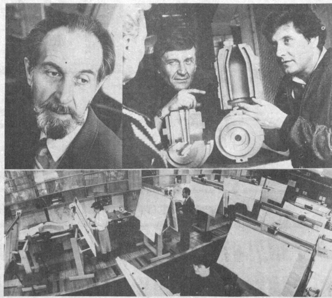
Фирма «Инструмент-ТС» НПО «Технолог» освоила выпуск металлоформ из жаропрочных сталей и чугуна для производства узкогорлой стеклотары. НТФ «Билдур», заказавшая металлоформы, уже приступила к выпуску бутылок для пива, вина, коньяков.

В заключение я хотел бы обратить внимание наших читателей на следующее. Рынок — это экономика, где главным требованием является ответственность гражданина. Во всех аспектах. Хочешь лучше жить — плодотворно работай, больше зарабатывай. Хочешь получить хорошую пенсию в старости — думай об этом сегодня, делай необходимые отчисления. Государство будет заботиться только о действительно беззащитных — детях из малообеспеченных семей, одиноких престарелых, инвалидах и других социально уязвимых слоях и группах. Трудолюбивый же человек должен максимально использовать свой трудовой потенциал.