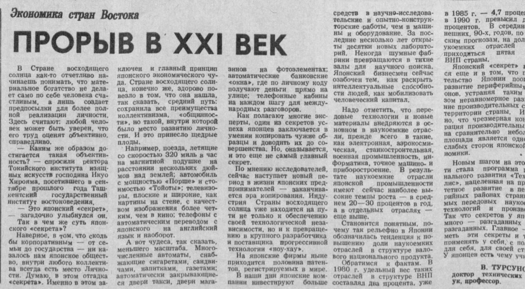
В 1985 г. — 4,7 процента, а в 1990 г. превысил десять процентов. В середине нынешних, 90-х, годов, по японским прогнозам, на долю наукоемких отраслей будет приходиться пятая часть ВВП страны. Японский «секрет» видится еще и в том, что правительство Японии поощряет развитие периферийных районов, устраняя таким образом неравномерное размещение производительных сил по территории страны. Известно, что чрезмерная концентрация производительных сил на сравнительно небольшой площади является одной из слабых сторон японской экономики. Новым шагом на этом пути стала программа регионального развития «Технополис», нацеленная на приоритетное развитие в периферийных районах страны самых передовых наукоемких технологий и производства. Так что секретов у японцев много — разгаданных и неразгаданных. Главное — суметь эти секреты и тайны применить у себя, для своей страны. У японцев есть чему учиться. В. ТУРСУНОВ, доктор технических наук, профессор.