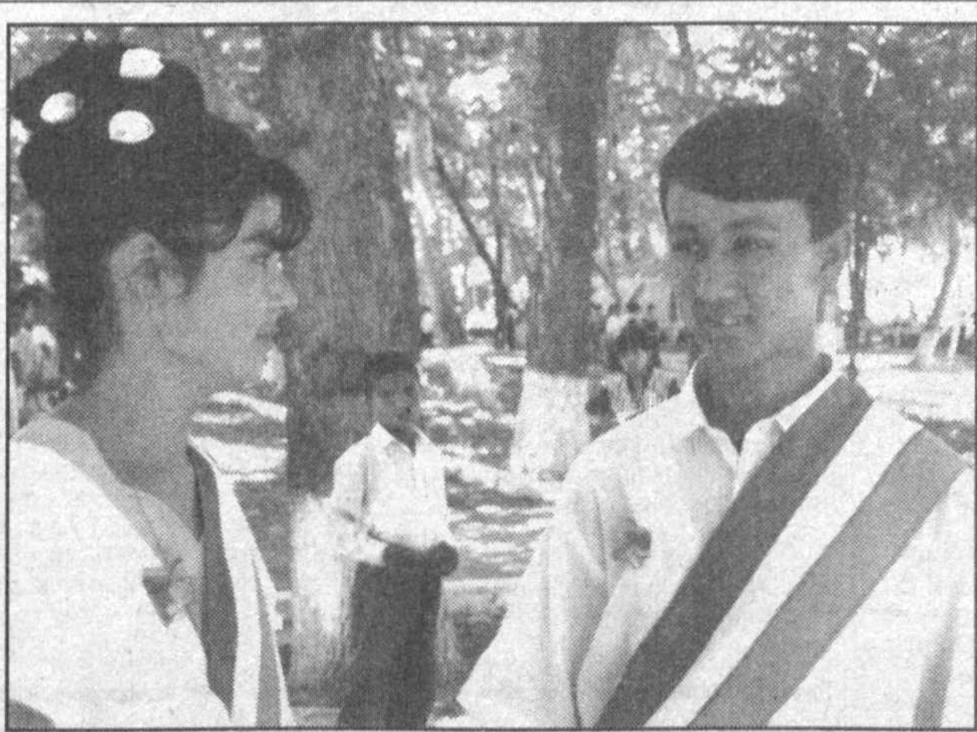
Они — выпускники!