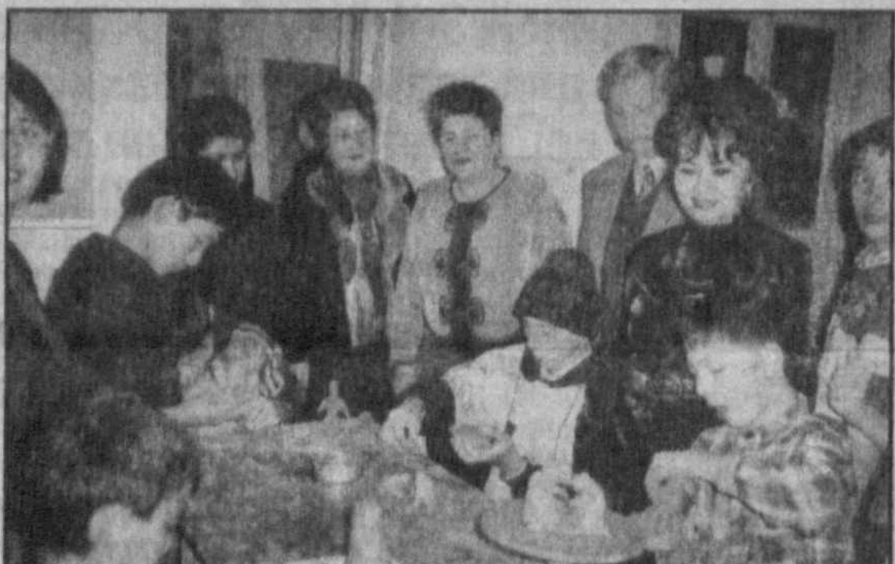
НА СНИМКАХ: дети Японии и дети Узбекистана, в студиях и залах Республиканского центра детского творчества.