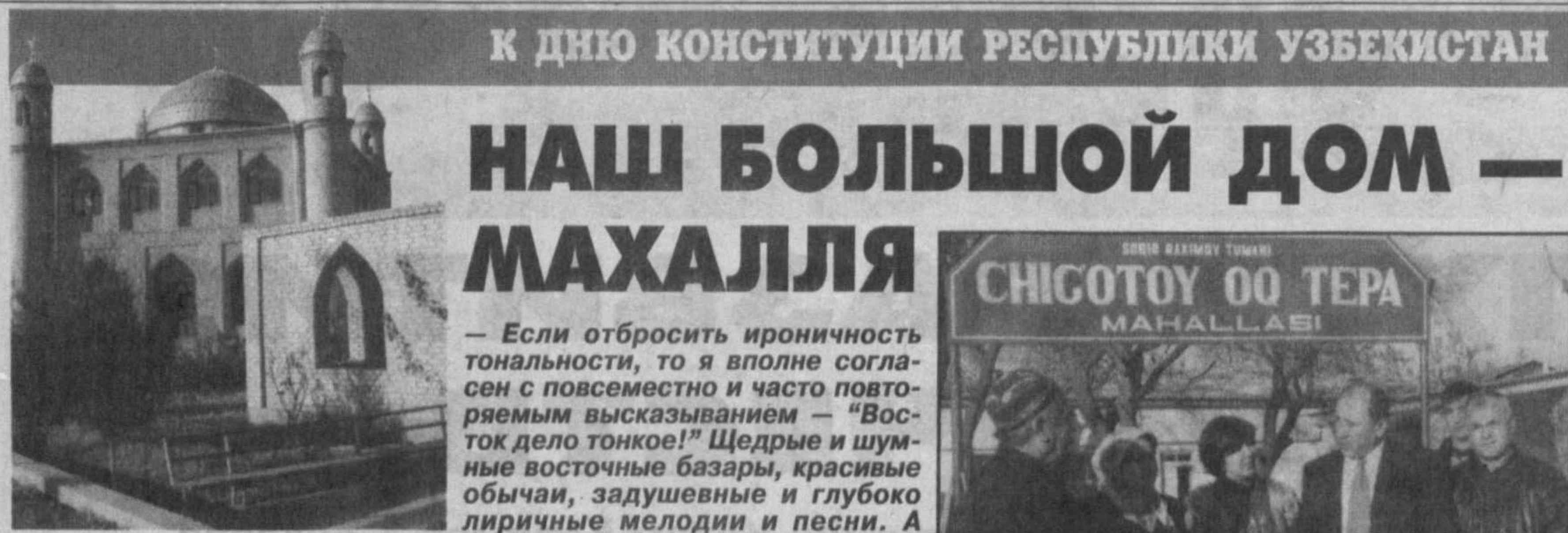
К ДНЮ КОНСТИТУЦИИ РЕСПУБЛИКИ УЗБЕКИСТАН