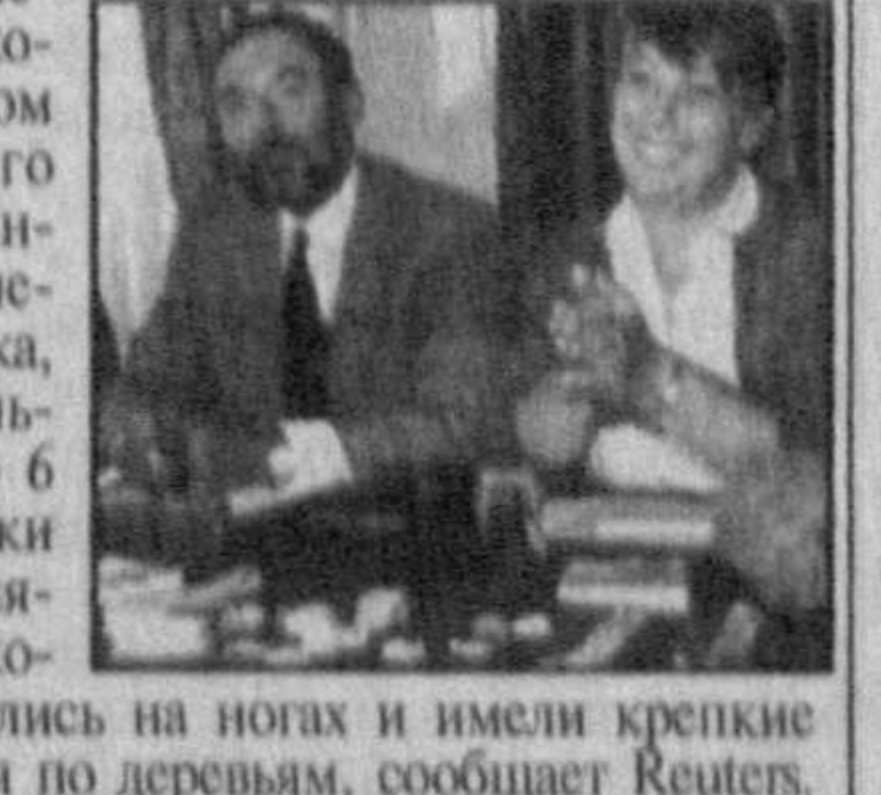
Во вторник стало известно, что группа французских и кенийских ученых раскопала в кенийском округе Баринго окаменевшие останки старого древесного вида человека, которым по меньшей мере около 6 млн. лет. Останки принадлежат питечьиим особям, которые переместились на ноги и имели крепкие руки для лазанья по деревьям, сообщает Reuters.