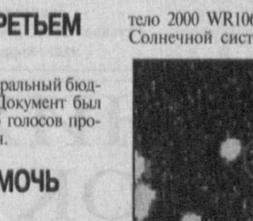
1300 км, сообщает BBC News.