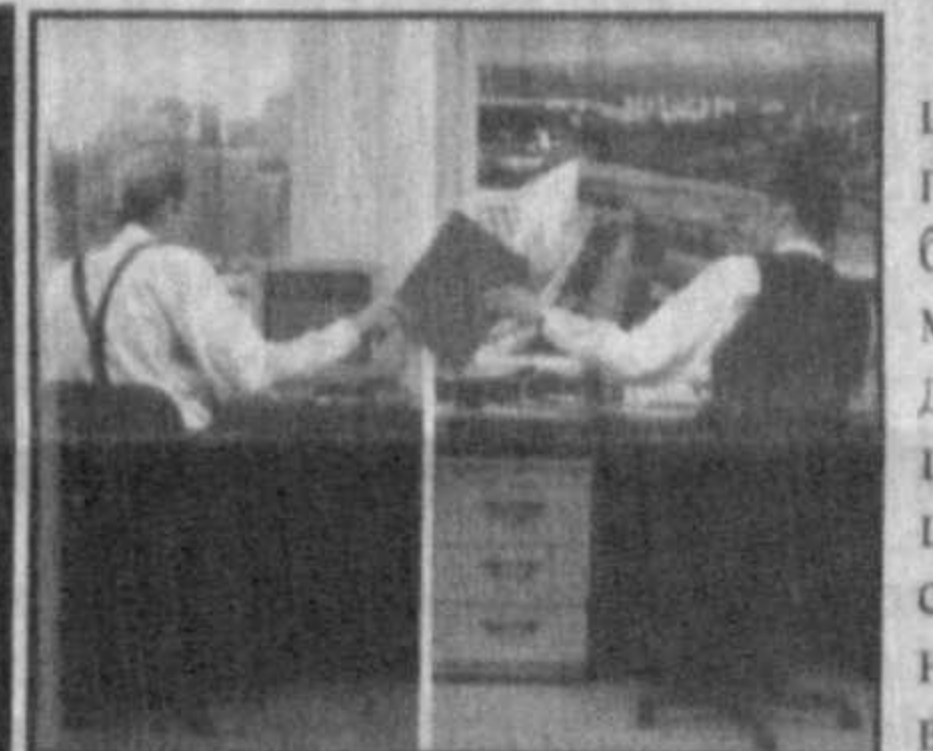
республики в сдержанно-приподнятой обстановке, в достаточно узком кругу заинтересованных лиц и в присутствии журналистов состоялась акт передачи контракта по проекту приватизации нашего национального оператора на рынке телекоммуникаций — АК «Узбектелеком».

НА 2-Й СТРАНИЦЕ В МАТЕРИАЛЕ «НАЧАЛО БОЛЬШОЙ ПРИВАТИЗАЦИИ»