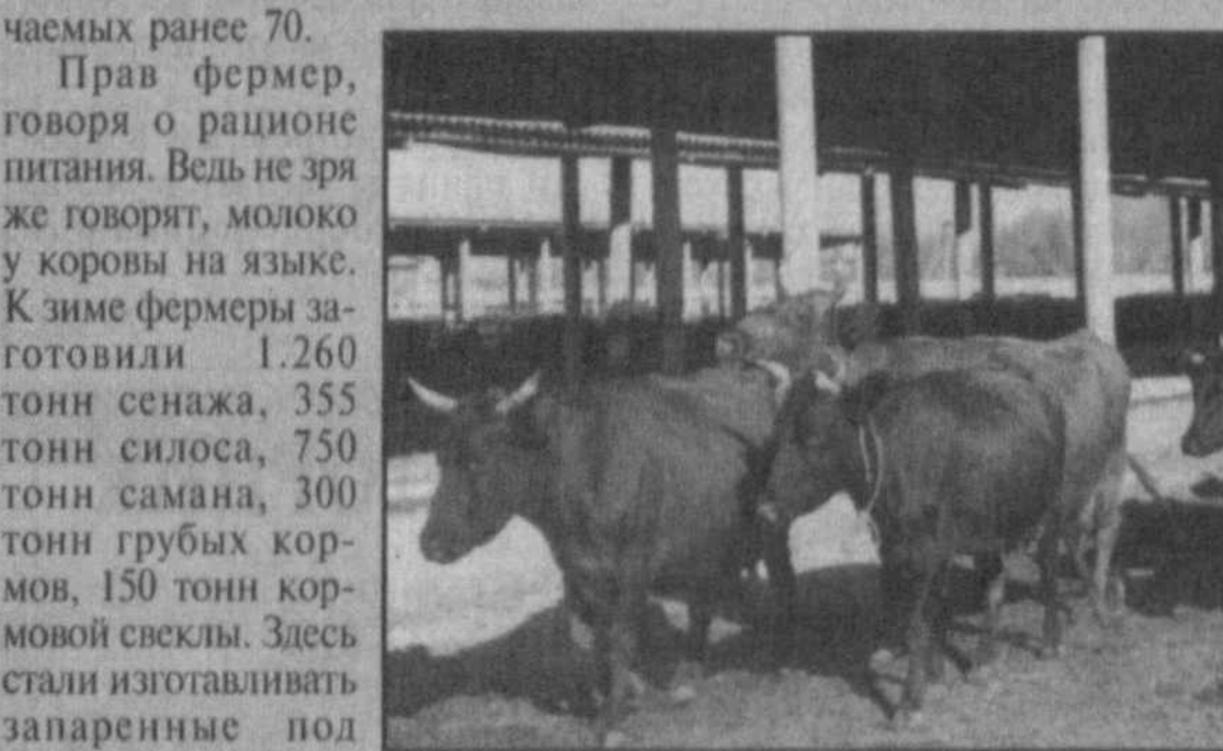
Высокой температурой смеси. Ежедневно каждая корова съедает по 15 килограммов этой смеси.

(Окончание. Начало на 1-й стр.) Как отмечалось, в системе министерства последовательно реализуется Закон «О государственном языке». Контроль за этим возложен на штаб МВД и службу по работе с личным составом. Принято специальное положение о комиссии по внедрению государственного языка.