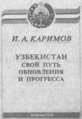
И. А. КАРИМОВ

УЗБЕКИСТАН СВОЙ ПУТЬ ОБНОВЛЕНИЯ И ПРОГРЕССА