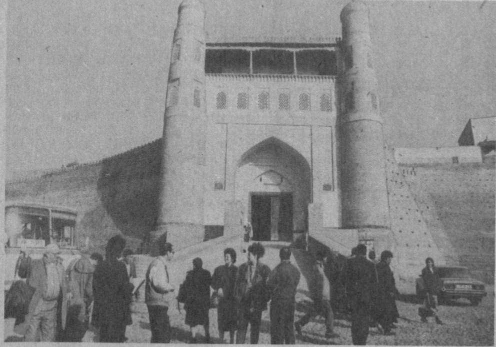
«СПУТНИК» РАСШИРЯЕТ СВЯЗИ

Первой группой, приехавшей в республику в соответствии с контрактом по безвалютному обмену делегациями, стали туристы из Алжира. Они посетили древние города Самарканд и Бухару. Знакомились с архитектурными памятниками, жизнью и бытом узбекских семей, творчеством мастеров прикладного искусства. Гости побывали в Высшем мусульманском духовном училище, действующих мечетях.