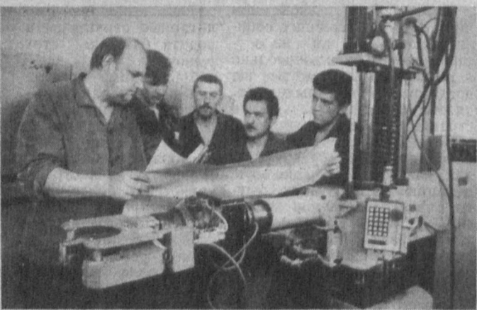
Первый день учебы в Ташкентском техническом университете.

Мы призываем всех студентов республики присоединиться к ней!