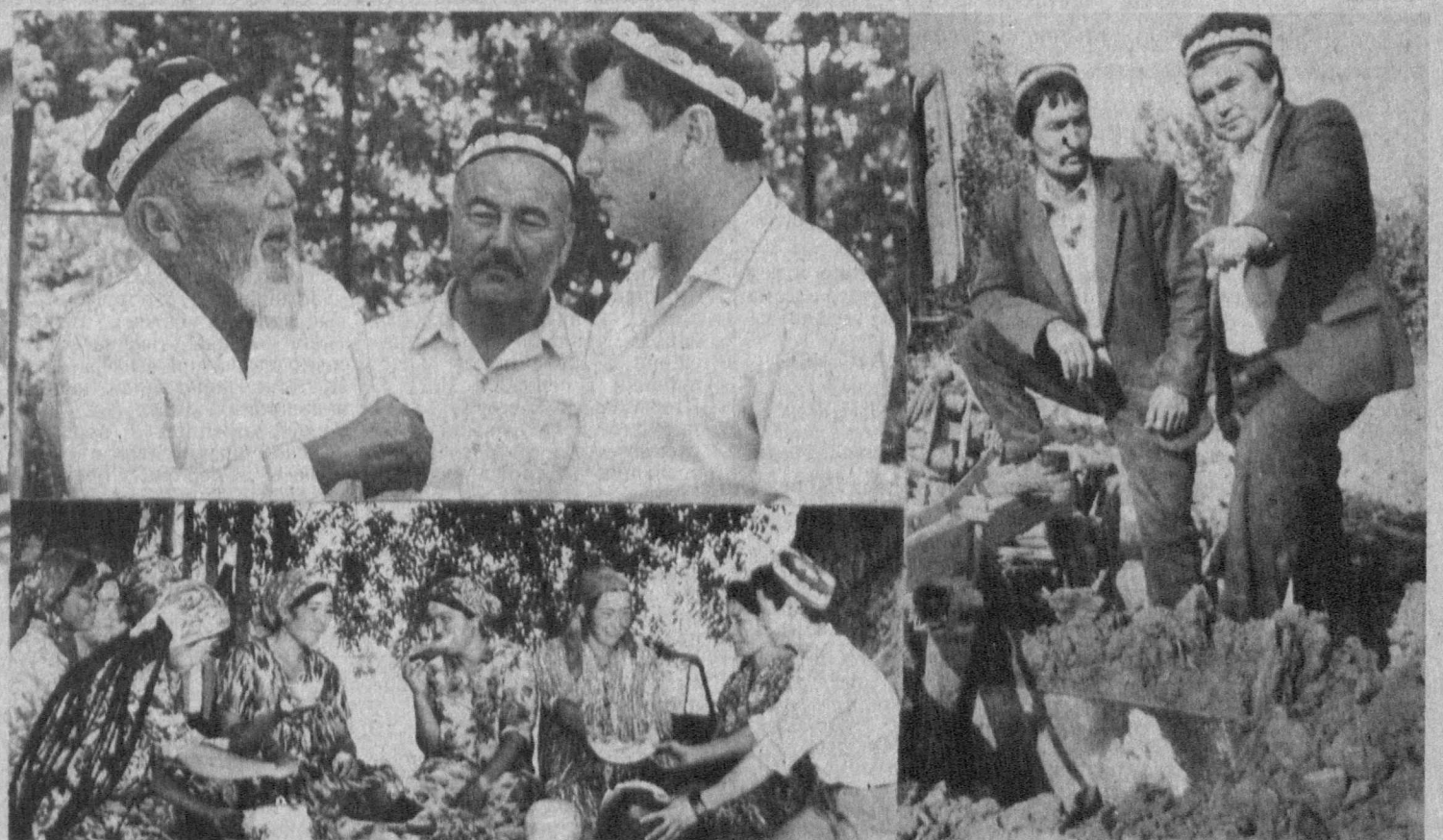
из самых уважаемых людей в колхозе. К его советам всегда прислушиваются; внизу — обед на пшпаше; справа — председатель правления колхоза «Гянт» Наманган-