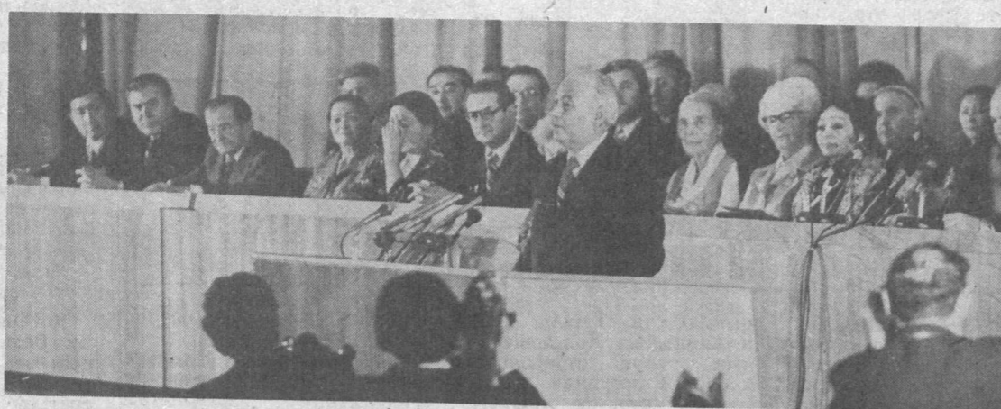
НА СНИМКЕ: Ш. Р. Рашидов на встрече с детьми культуры Узбекистана.