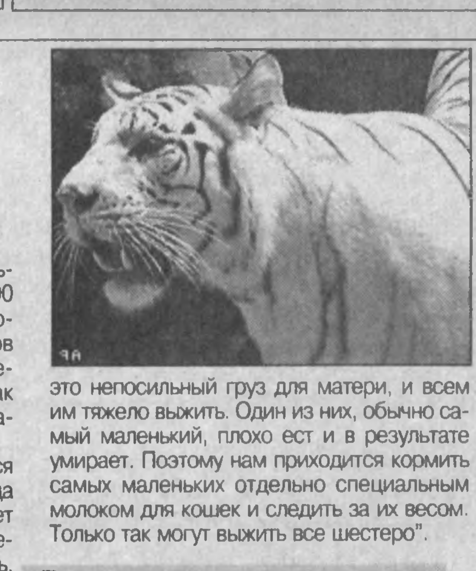
Подготовлено по материалам зарубежных СМИ.