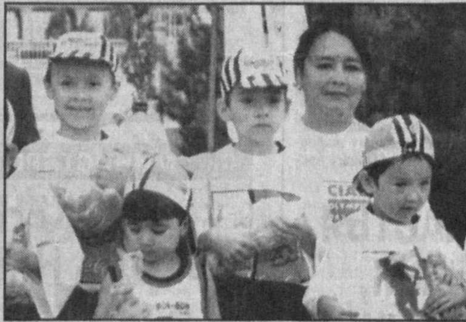
НА СНИМКАХ: бегунам и дождю не помеха; если с этих лет заниматься спортом — можно вырасти в известного спортсмена.