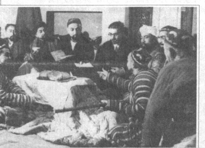
СУРАТДА: «Муқимий» спектаклидан саҳна. Муқимий ролида Ўзбекистон халқ артисти Раззоқ Хамроев.