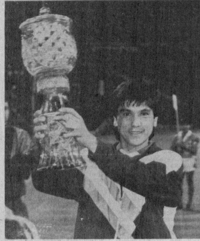
Завершился международный турнир по футболу, проходивший в Ташкенте. Первое место по праву завоевали футболисты сборной команды Узбекистана.