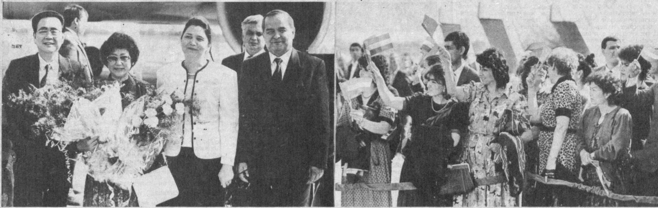
НА СНИМКЕ: проводы в аэропорту.