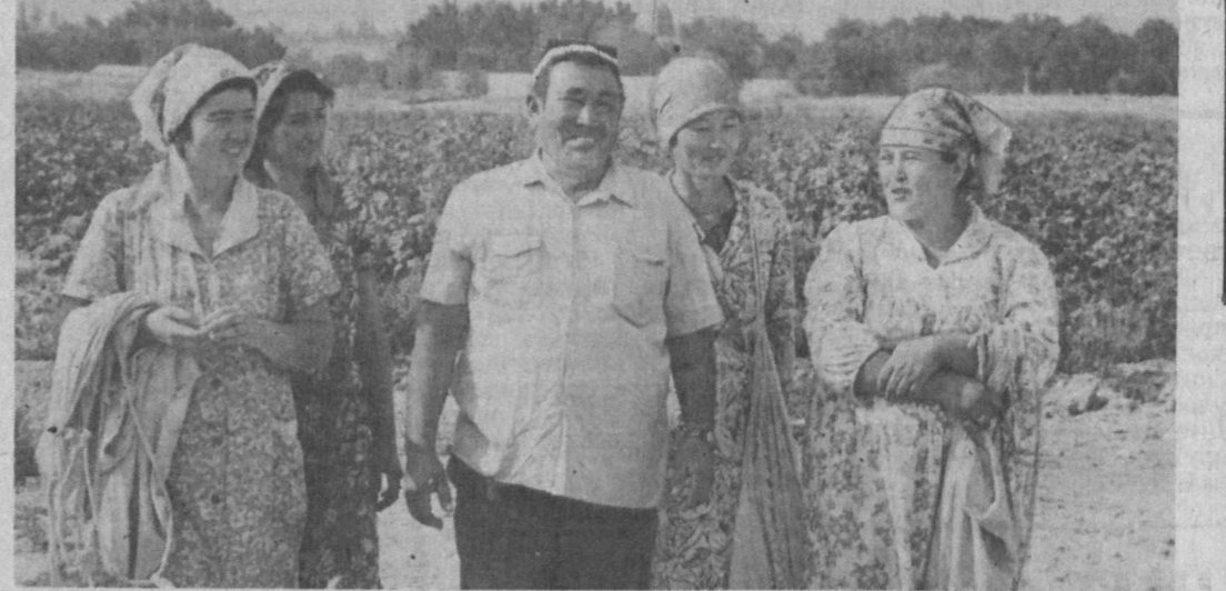
Началась «белая страда» в совхозе «Новбахор» Бекабадского района Ташкентской области. На полях хозяйства появились люди, техника. Хозяйственники долго ждали этого момента — когда поспели корочки.

Предложено оборудовать всем необходимым школьные столовые, изыскать возможность выплаты наличных ученикам сумм в счет 50-процентной скидки за счет бюджета республики.