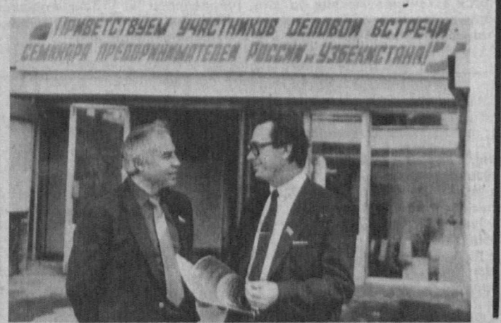
ПРИВЕТСТВУЕМ УЧАСТНИКОВ ДЕЛОВОЙ ВСТРЕЧИ-СЕМИНАРА ПРЕДПРИНИМАТЕЛЕЙ РОССИИ И УЗБЕКИСТАНА